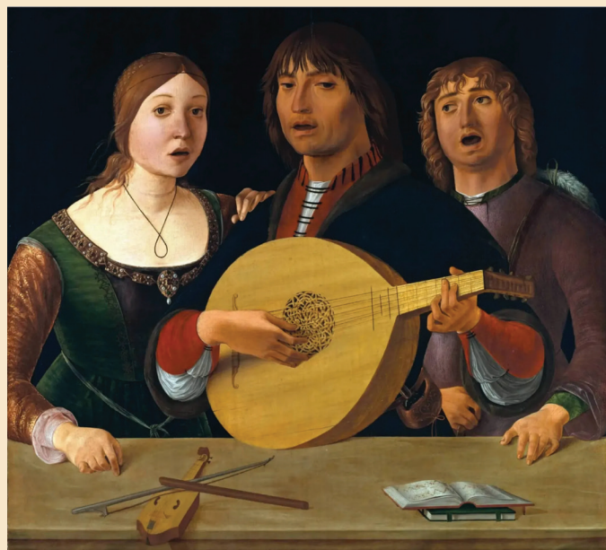
Concierto. Lorenzo Costa ca. 1485-95 National Gallery, Londres